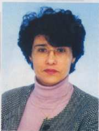
THOUINI / FICHAMBE

Professeur de psychiatrie et praticienne au centre hospitalier Ibn Rochd à Casablanca, elle codirige l'un des plus grands centres de soins psychiatriques en Afrique, plus connu sous le nom de